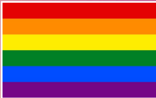
ธงสีรุ้ง