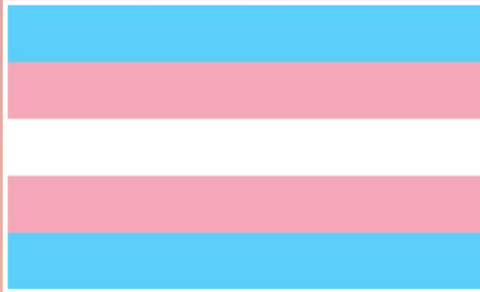
عبر علم الفخر