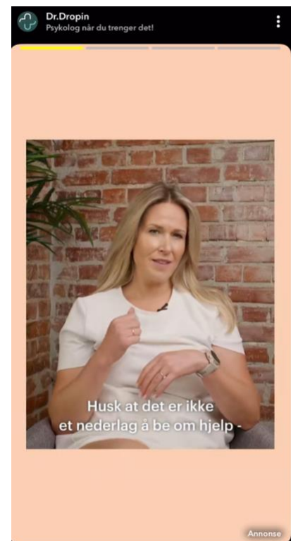
Figur 7: Snapchat-reklamevideo for «Dr.Dropin- Psykolog når du trenger det» (2023).