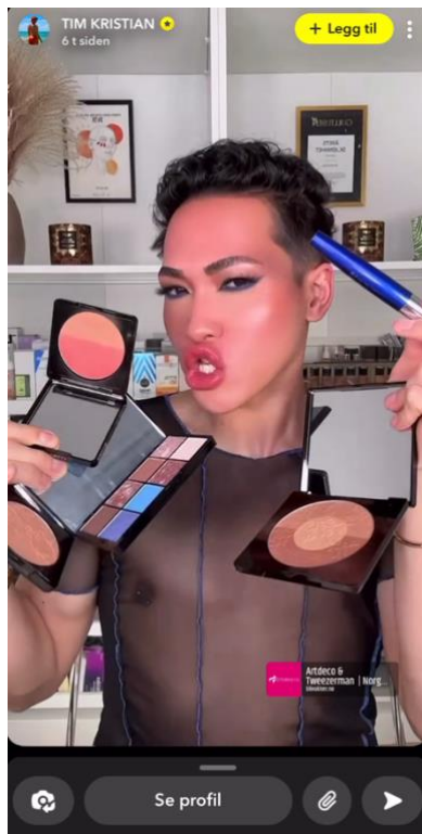
Figur 5: Snapchat-reklamevideo gjennom influencer Tim Kristian, «BliVakker.no» (2023).