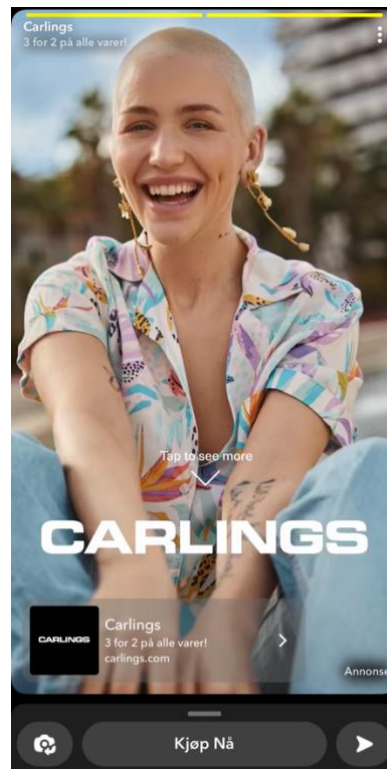
Figur 6: Snapchat-reklame for klær fra «Carlings» (2023).