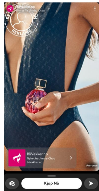
Figur 2: Snapchat-reklame for rosa parfyme fra «BliVakker.no» (2023).

Ungdommene forteller at de ser en parfyme i reklamen, og mener reklamen er rettet mot jenter. Sofia stiller spørsmål til hvorfor parfymereklamen velger å ha med så mye kropp i reklamen, og sier så at dette er strategisk for å oppnå mer markedsføring. Ada sier at reklamen spiller på kropp, og Erika drar paralleller mellom reklamens navn «Bli vakker» og at det er noe som kan være en forventning til jenters utseende. Ungdommene stiller seg kritisk til bruken av kvinnekroppen i markedsføringen av parfymen. De viser en motstand til den uønskede seksualiseringen av kvinnekroppen, og sier noe om hvilken verdi repertoaret har hos dem. De viser en bevissthet rundt kjønnet markedsføring, og viser samtidig hvordan de assosierer nettbutikkens navn «bli vakker» til et skjønnhetsideal reklamen spiller på ved å velge en kropp som ungdommene omtaler som «vakker». I lys av Giddens (1991:75) forståelse av den refleksive modernitet, ser man her hvordan ungdommene reflekterer over egen identitet, ved at de bruker subjektposisjonen sin til å distansere seg fra seksualiseringen i reklamen. Denne kritiske inngangen til reklamen forteller noe om hvordan de selv ikke aksepterer budskapet i reklamen, men at de likevel må forholde seg til denne diskursen på et nivå, noe de viser gjennom bevisgjøringen av den kjønnede markedsføringen. Dette forteller også noe om hva som er «passende» å mene om skjønnhetsidealet som reklamen spiller på.