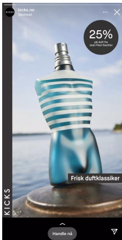
Figur 4: Snapchat-reklame for parfyme fra «Kicks.no» (2023).

sårt og vanskelig. Gruppeintervju-situasjonen kan også påvirke hvordan ungdommene vil fremstå foran de andre i gruppen, hvor det kan oppleves som viktig å «passe inn» i kjønnsidentiteten som forventes av Didrik (Waldahl, 1999:160). Ytringene til ungdommene blir derfor tolket med en forståelse i konteksten av å være ungdom, gruppeintervju-situasjonen, og i et fortolkningsmiljø hvor reklamen er bakgrunnen for meningsdannelse. Her kan det å passe inn og ikke bli sett på som annerledes oppleves som viktig for ungdommene.