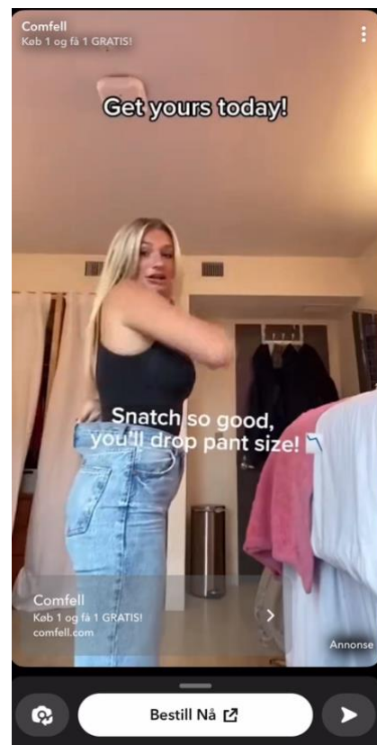
Figur 3: Snapchat-reklamevideo for Shapedrakt- «Comfell.com» (2023).