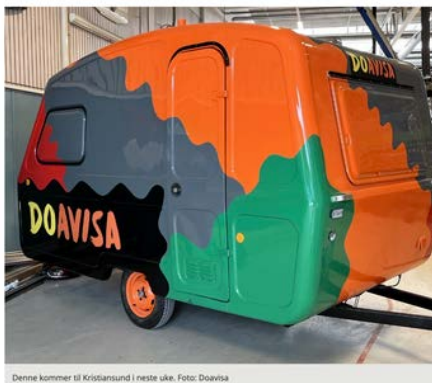
Denne kommer til Kristiansund i neste uke.